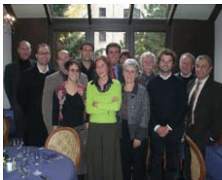
Le groupe des partenaires à Bruxelles

Par ailleurs, cette semaine a été l'occasion de faire la promotion de nos territoires et de notre projet auprès des différentes institutions européennes.