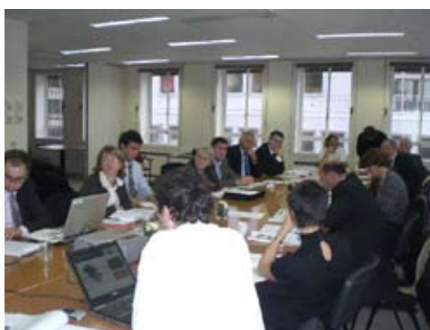
Présentation du guide et bilan de la coopération

Cette clôture a été effectuée en présence d'élus et de techniciens des territoires partenaires tels que la Communauté de communes du Pays de Montmarault, le Conseil général de l'Allier, la Commune de Belis et le Judet de Cluj.